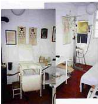
Beim Arzt, Dorfmuseum Mönchhof

Bewölkt und mäßig warm. Mit dem Rad durch Weinberge, Gerstenfelder und eine blühende Holunderplantage geht es ohne Steigungen nach Halbturn. Wir sehen Hasen und Fasane. Halbturn ist eine barocke Schlossanlage.