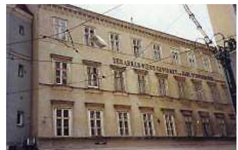
Gemeindebau für die „Armen“ in der Josephstadt

Im wesentlichen folgen wir der Vorstadtrad-Route nach Hause. Trocken und unter dunklen Wolken kommen wir gegen 18 Uhr nach Hause. Abends Balkon-Brotzeit, ab 20 Uhr regnet es.