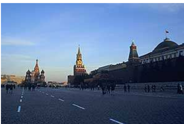
Roter Platz in roter Abendsonne

Im Licht der untergehenden Sonne (es ist schon 1/2 9) noch ein Spaziergang über den Roten Platz, bereits verlassen von den Besichtigungs-Gruppen und Souvenirhändlern. Ich lege noch eine Reminiszenz beim Hotel "Rossija" ein und überzeuge mich davon, dass der Betten-Gigant nach wie vor ordentlich funktioniert und sich einer lebhaften Nachfrage erfreut. Die Gäste scheinen weniger unter der vielgeschmähten Kasten-Architektur zu leiden als es vielmehr zu schätzen zu wissen, in so exzellenter Lage ein erschwingliches Quartier vorzufinden. Soviel man hört, soll damit bald Schluß sein, denn ein scharf rechnendes Konsortium will an dieser Stelle ein weiteres High-End-Etablissement errichten, mit einem Bruchteil der Gästebetten, dafür für den vielfachen Preis. Good Bye, Rossija!