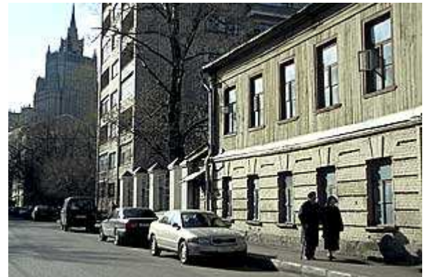
Straßen in Moskau (3): Gagarinskij Pereulok

Ausgehend von der Pretschistenka Uliza, folge ich dem "Grand Houses Walk" aus dem Lonely Planet Guide, der wieder zum Arbat hinaufführt. Entlang des Weges durch geruhsame kleine Straßen schöne Beispiele der vielfältigen Epochen Moskauer Architektur, insbesondere des Klassizismus und des Art Nouveau. Hier offenbart Moskau seine inneren, nur zu Fuß zu erschliessenden Reize, und auch ein wenig fast kleinstädtisch anmutender Atmosphäre. Auf der Arbat-Straße kehre ich wieder im "Promenad" ein, nachdem sich herausgestellt hat, dass die Eingänge anderer Lokale schnurstracks in den Keller hinabführen - keine gute Wahl für so einen schönen Nachmittag.