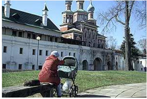
Mütterchen Rußland genießt die Frühlingssone: Nowodewitschi-Kloster

Auch hier gespaltener Eintrittspreis, aber auch hier gelingt es mir, der Kassierin "den Russen zu machen". Dabei kommt mir bestimmt die eher wortkarge Attitüde des russischen öffentlichen Verkehrs entgegen, vielleicht aber auch mein parka-farbenes "Field Jacket" des US-Ausstatters "Land's End", das hier recht kompatibel ist. Möglicherweise erwartet man hier auch noch gar nicht, dass Ausländer jenseits geführter Gruppen auftreten. In der Tat ist es auch heutzutage gar nicht einfach, sich durch Moskau zu bewegen, ohne zumindest die russische Schrift zu kennen. Bisher habe ich noch niemanden Englisch sprechen gehört und, wo ich eingekehrt bin, noch keine englische Speisekarte gesehen.