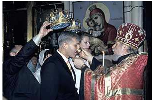
Heiraten heute (1): Einmal König sein

Auf dem Weg in die Innenstadt mache ich einen Abstecher zur Kirche "St.Nikolaus der Weber" (Komsomolskij prosp.2), da diese an Farbenfreude gar der Basilius-Kathedrale Konkurrenz machen soll. Dort werde ich Zeuge eines wesentlichen Aspekts des neuen russischen Lebens - der Kirche in Aktion - in Gestalt einer Hochzeitszeremonie. Der Geistliche singt, unter gelegentlichen Heiserkeitseinbrüchen, endlose Litaneien. Diese sekundiert ein Sänger/innenquintett aus einer anderen Ecke der Kirche mit süßlich jublierenden Tönen. Währenddessen werden dem Brautpaar von hinten Messing-Kronen über die Köpfe gehalten. Die Bedauernswerten, die diese Kronen halten müssen, wechseln diese immer wieder von einer Hand in die andere, da ihnen die Arme zu erlahmen drohen. Schließlich gibt der Pope was zu trinken - aber nur dem Brautpaar -, nimmt dieses bei der Hand und führt es mehrmals im Kreis herum. Die Kronenträger, die jeder Bewegung folgen müssen, haben dabei alle Mühe, der Braut nicht auf die Schleppe zu treten.