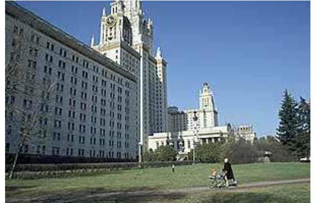
Alma Mater: Lomonossow-Universität

Das Nowodewitschi (Jungfrauen) -Kloster bietet ein bisschen "Mütterchen Rußland"-Feeling mitten in der ausufernden Metropole. Die Kuppeln glänzen wie erhofft in der Sonne, Mensch und Natur genießen den ersten Hauch von Frühlingwärme, und eine Alte liefert das passende Bild pittoresker Armut dazu. In einen flickenbesetzten schwarzen Wintermantel gewandet, beißt sie in einen roten Apfel.