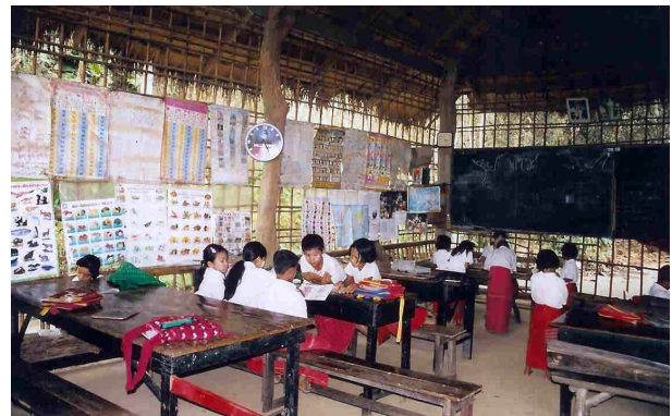
Schule im Mon-Dorf