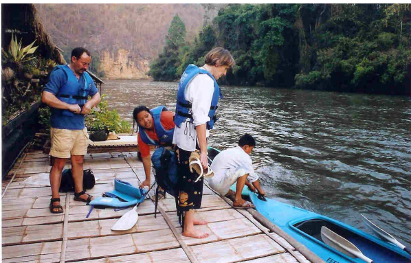
Start zur Kanufahrt

Im Resotel ist eine burmesische Atmosphäre zu spüren: Die Angestellten gehören zum Bergvolk der Mon, tragen Longyies und bemalen ihre Gesichter mit Tanaka, einer gemahlten Rinde, die vor Sonne schützt. Bei einem dreistündigen Ausflug fuhren mit dem Hotel-Boot zum „Jungleraft“, einer Resotel-Filiale, die aus schwimmenden Häusern besteht. Dahinter liegt ein Mon-Dorf, wo man die lebhafteste Schule und typische Wohnhäuser besichtigen sowie Waren aus Myanmar kaufen kann; ein Beispiel für Ökotourismus. Zurück paddelten wir mit Kajaks. www.junglerafts.com .